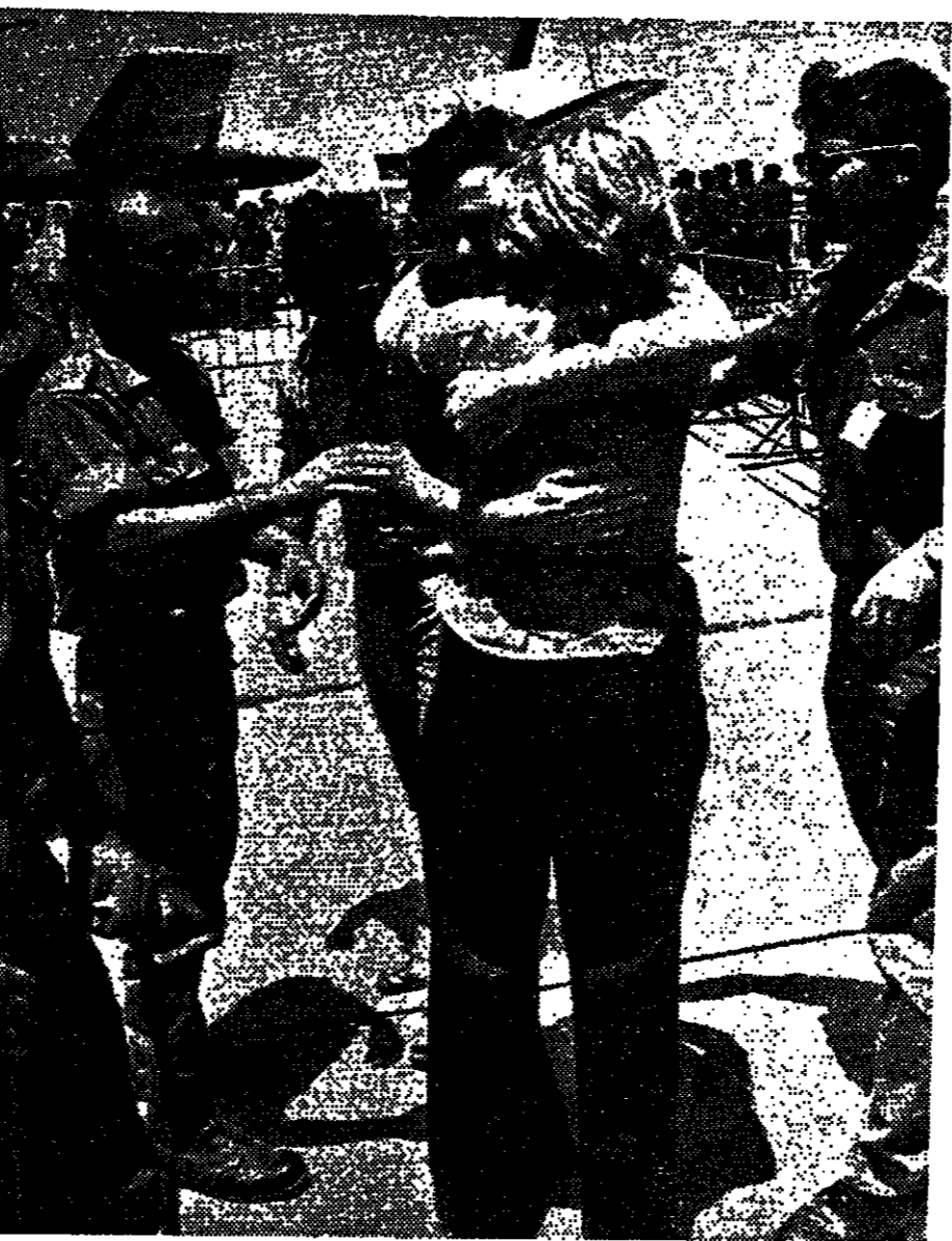
סורים ניהו והשבו הראשון שירד אומבול ממשום הצלב-הצהרם בגמל-התעופה בין-הצדדים. מלווה הוא רץ לעבר הברווז והמועצה שהמועצה לו. בממונה: בורוכות הברווז, חיבוק ראשון לאויר שבי בביטחון.